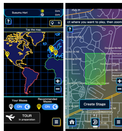
ステージ作成画面(開発中のものです)