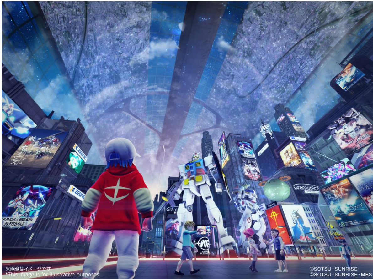
〈「ガンダムメタバースプロジェクト」イメージ〉

キャラクターの権利が保全されたメタバースを構築し、本取り組みを実施することで、新たなガンダムのビジネスが生まれ、ファンと共創したガンダム IP のさらなる拡大につながることを期待しております。