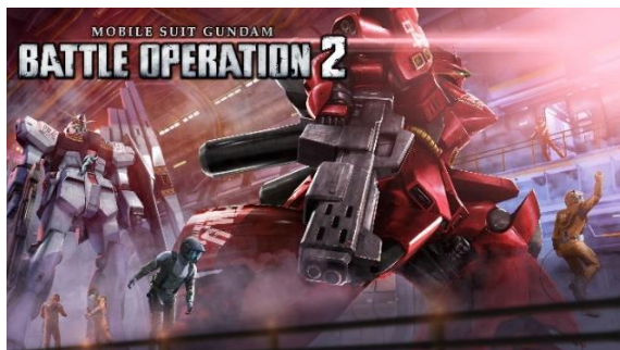
＜『機動戦士ガンダム バトルオペレーション2』＞