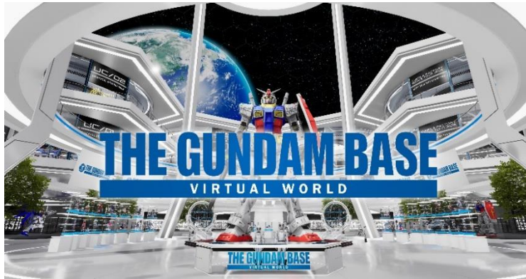
＜「ガンダムベースヴァーチャルワールド」＞

また、バンダイナムコIDによるマイルーム機能を実装し、ガンプラの作品を通したコミュニティを形成いたします。さらに、ガンプラをスキャンして戦うことができる「ガンプラバトル」や「ガンプラコンテスト」の開催、ガンプラオンライン講座など、デジタルとフィジカルを融合させたエンターテインメント区画を充実させ、「ガンプラコロニー」の完成を目指してまいります。